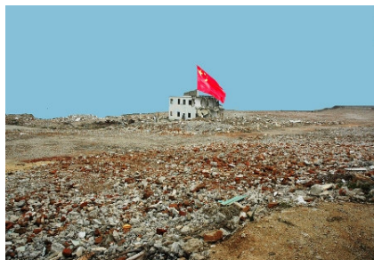
© Maria Rebecca Ballestra/Galerie KernotArt, Kisses from China I , 2008, Impression lambda sur dibond, 60x90 cm.

Jury Prize , Exhibition Nature et Artifice Salon des Artistes Monegasques de l'AIAP et de l'UNESCO.